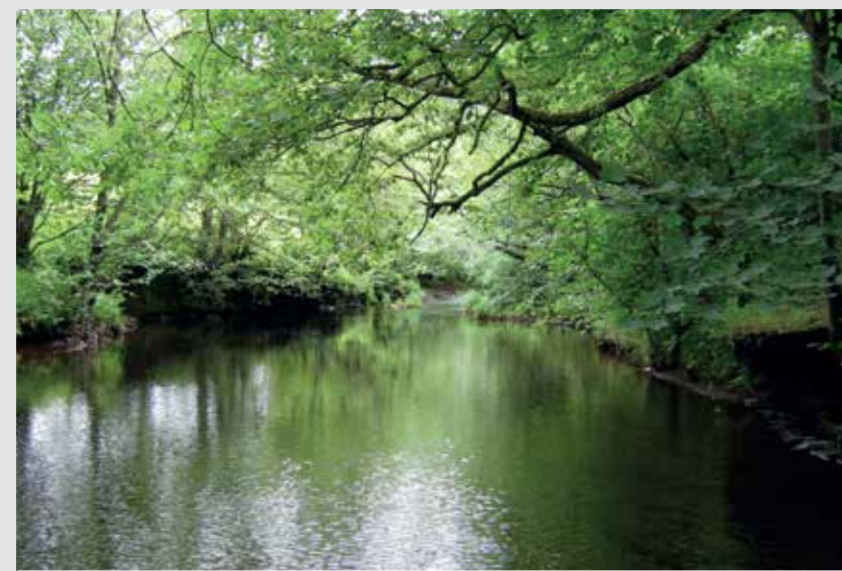
Afon Efyrrwy River Vyrnwy