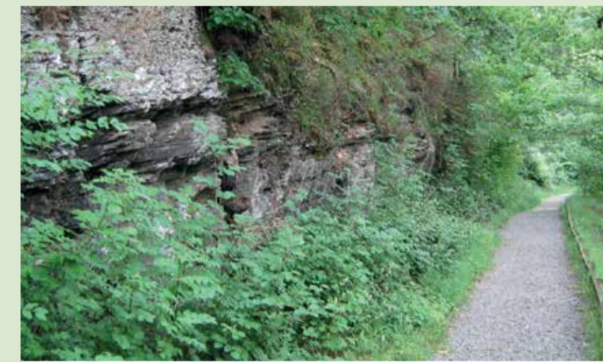
Llwybr Pont Llogel Pont Llogel Walk