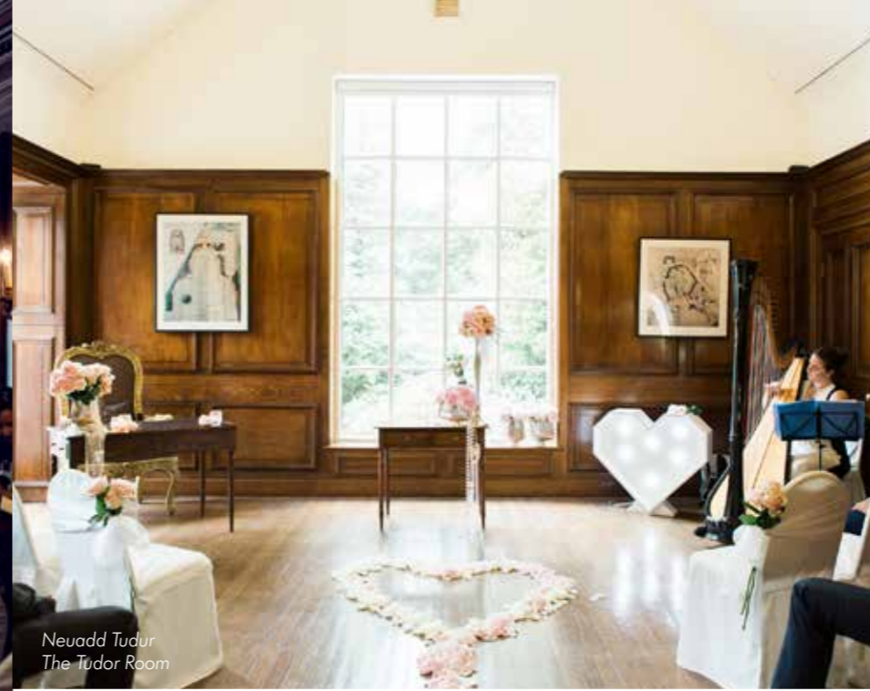
Neuadd Tudur The Tudor Room