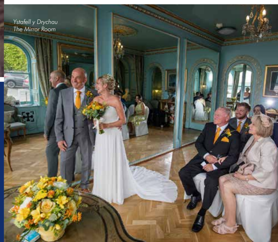
Ystafell y Drychau The Mirror Room