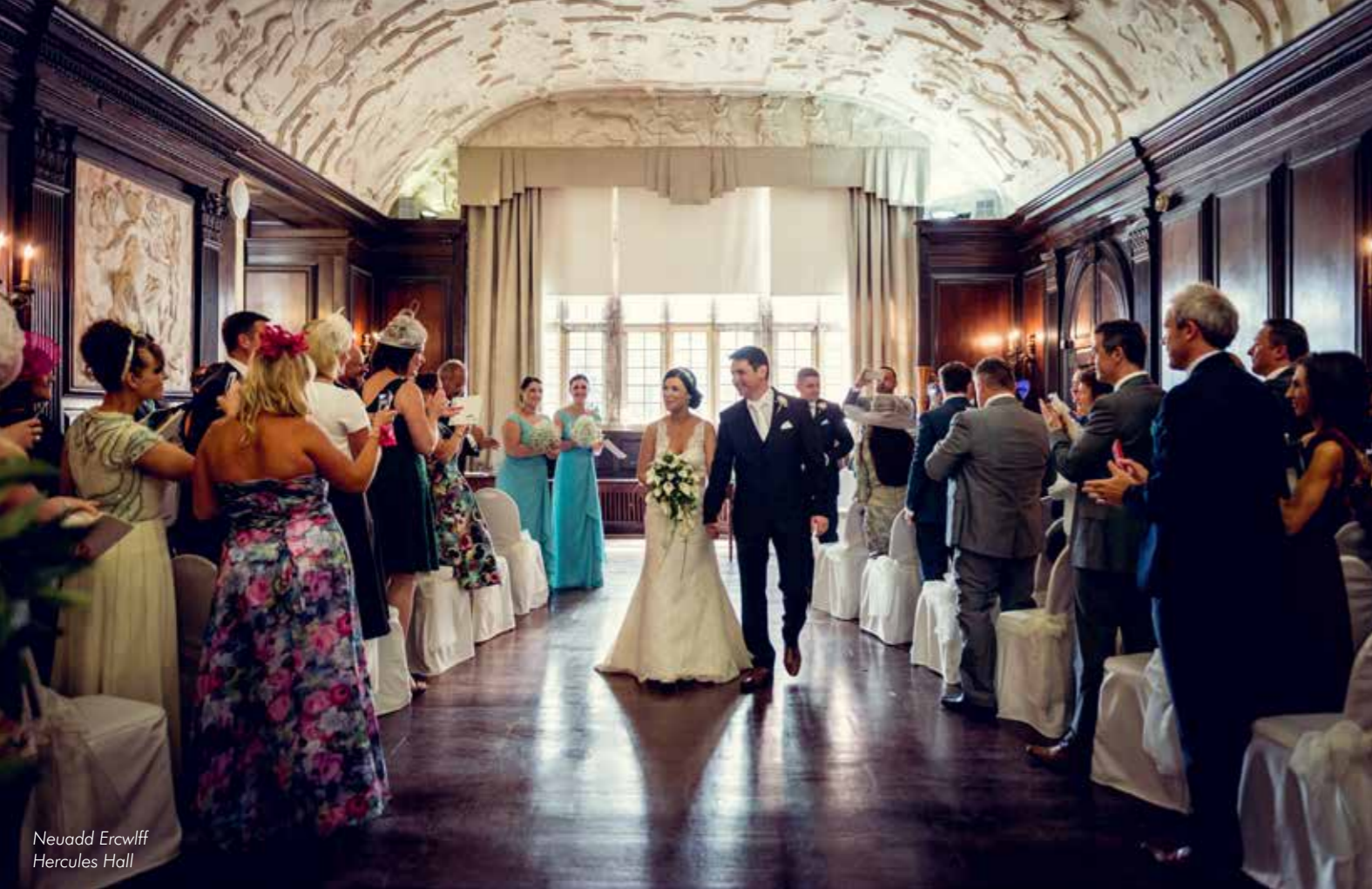
Neuadd Ercwlff Hercules Hall